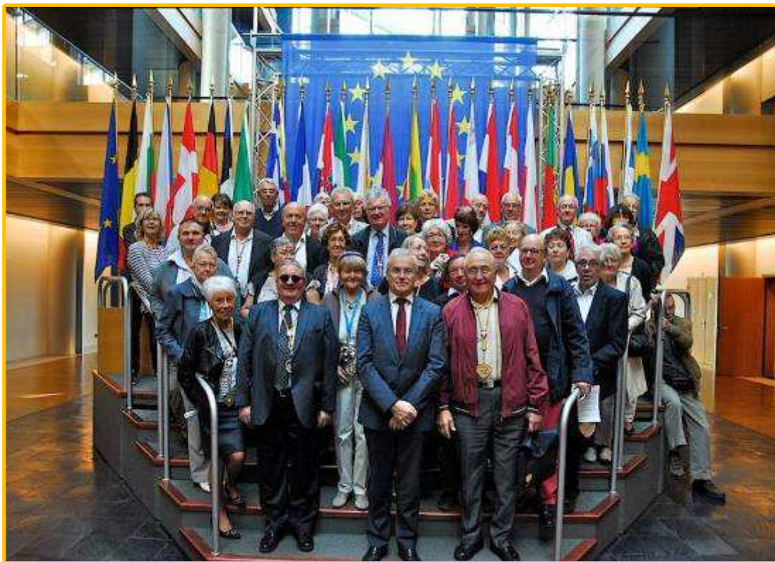
Le Portique Ducal