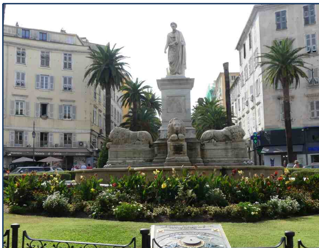
Alpe Dauphiné AJACCIO Statue de Napoléon