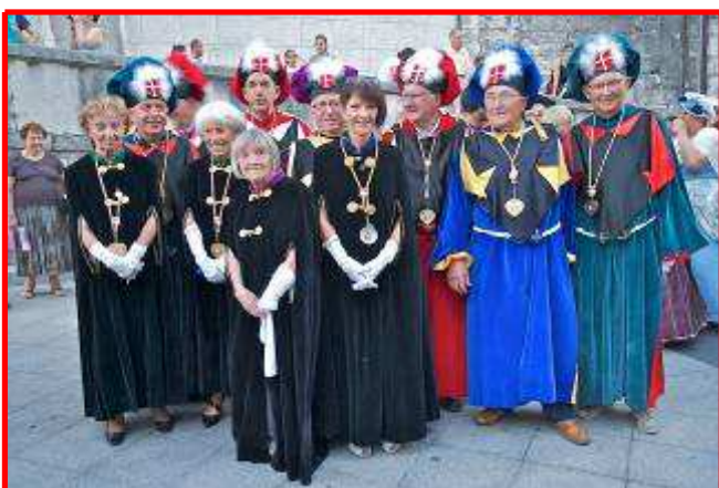
Le Portique DUCAL