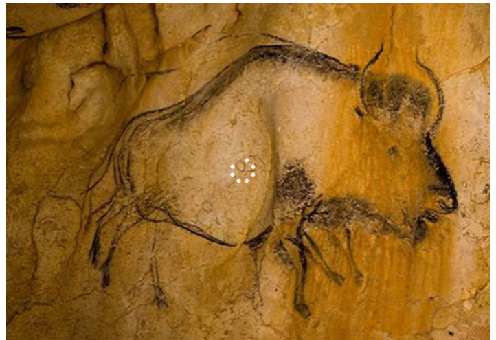
Vues de la Grotte Chauvet