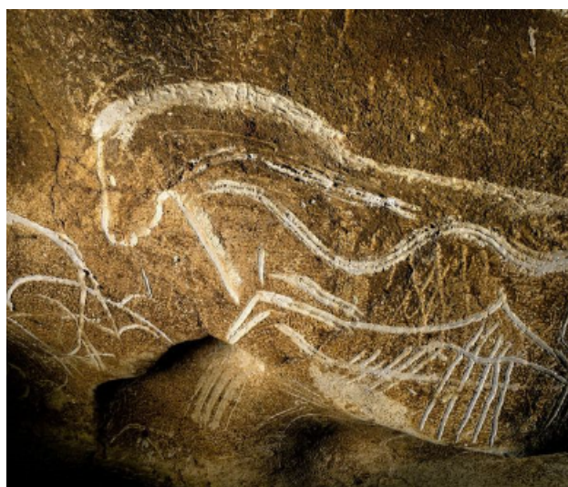
Le Major Prime

PS : Passé cette date... Si nous n'obtenons pas un nombre minimum de 30/35 Compagnons et Sympathisants, le voyage sera irrémédiablement supprimé !